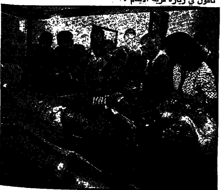
الرئيس ناسون في متحف القاهرة